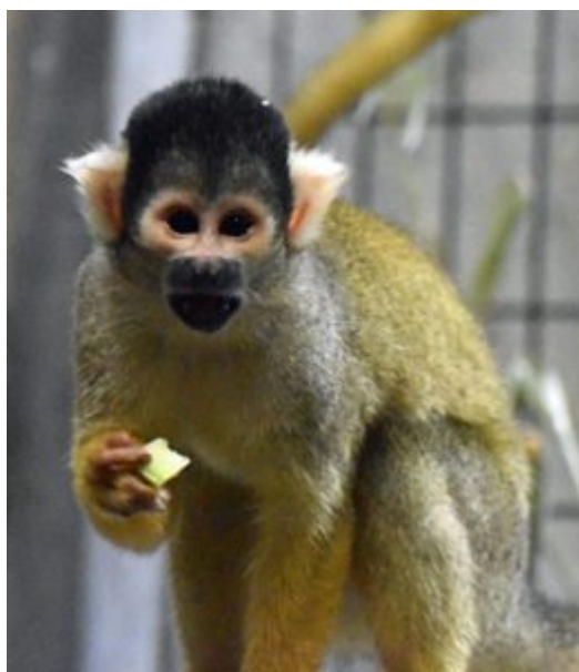
Saimiri Singe-Ecureuil Zoo de Bâle

Cinq singes-écureuils (également appelés saïmiris) jouent les équilibristes à travers les branchages du Zoo de Bâle avec leurs petits sur le dos. Venus au monde entre le 19 juin et le 12 juillet, il est encore trop tôt pour dire s'il s'agit de jeunes mâles ou de femelles.