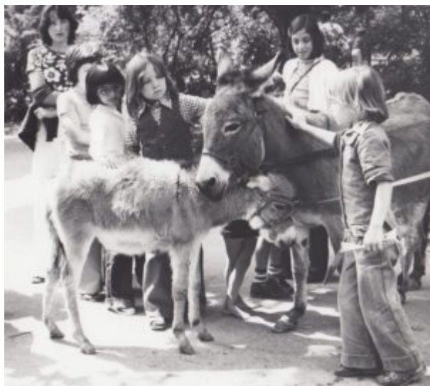
Zoo des enfants Bâle

Depuis son inauguration le 25 août 1977, le zoo des enfants permet aux plus jeunes d'aider à prendre soin des animaux. Les soigneurs en herbe retirent de ces rencontres une relation empreinte de respect et de confiance. Le zoo des enfants est l'une des composantes clés de l'offre de formation très fournie du Zoo de Bâle.